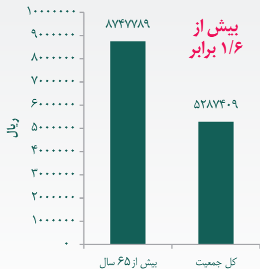
متوسط سرانه پرداخت مستقیم از جیب در جمعیت‌های با سرپرست خانوار سالمند (بالای ۶۵ سال) و در سطح کل جمعیت